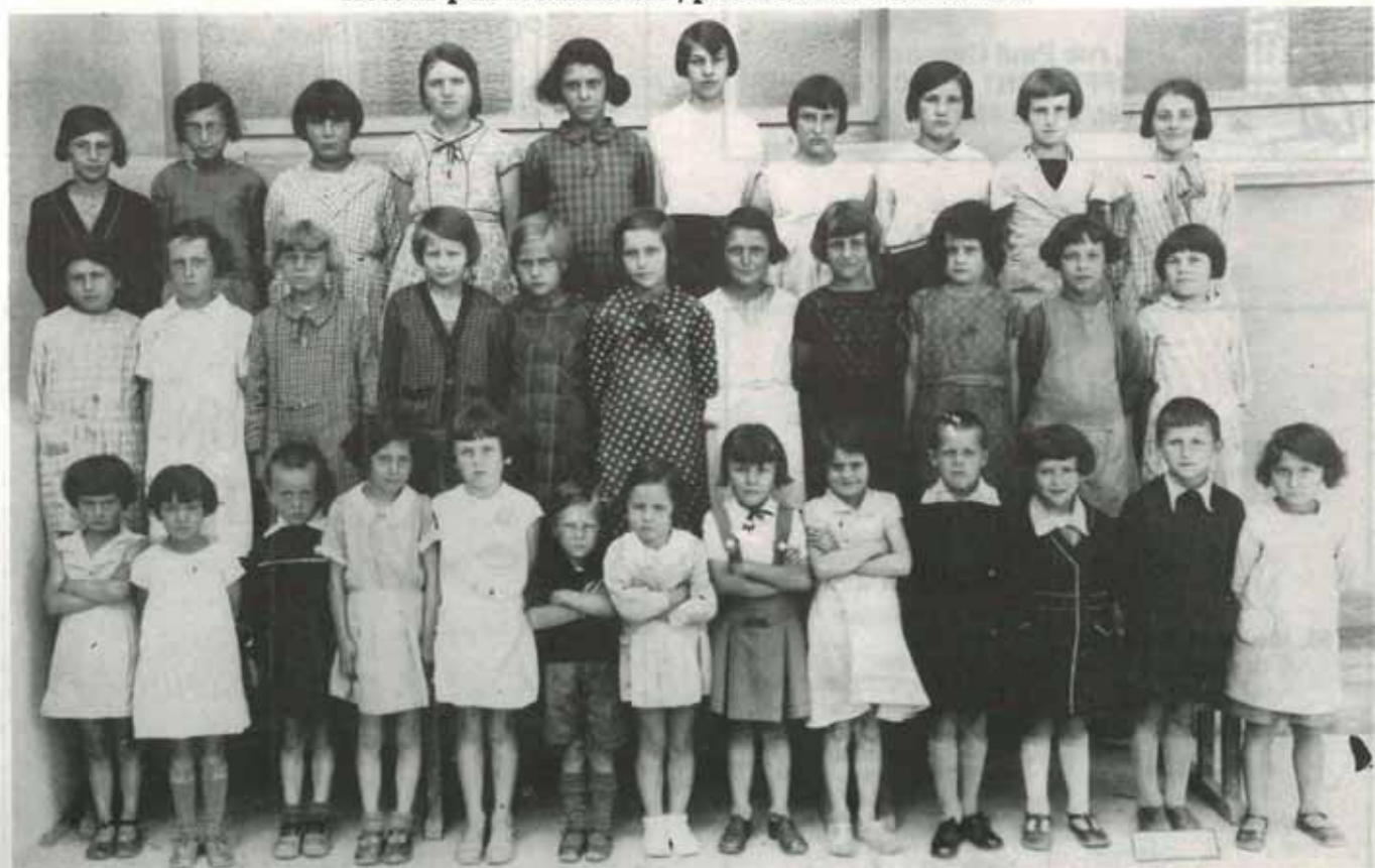
Une classe des années 30.