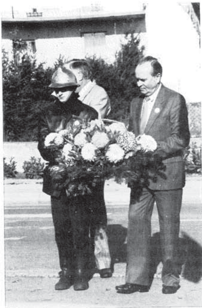
M. le Maire et un pompier déposent une gerbe...

... devant le monument superbement fleuri.