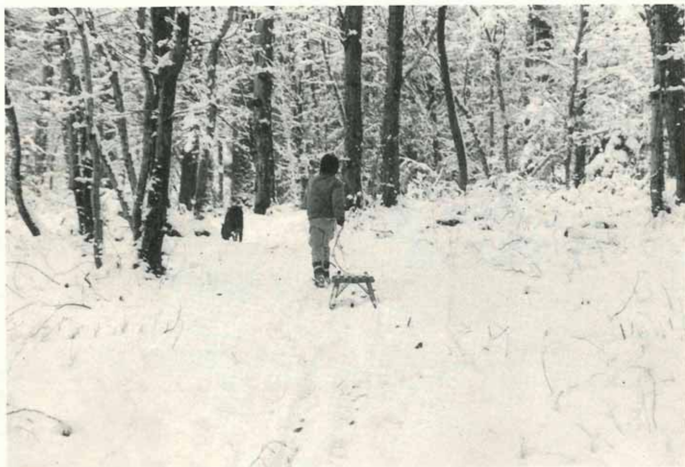
Joies de la neige en forêt.