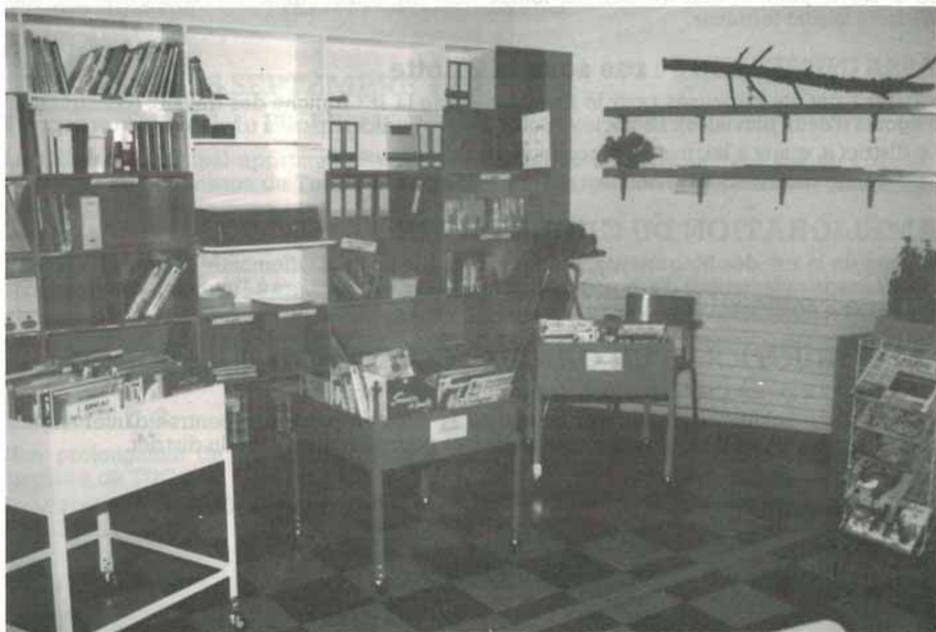
L'œuvre des employés communaux à l'école Jean Macé.

Les ouvriers communaux ont fabriqué des bancs pour la maternelle. Ils ont aménagé une bibliothèque à l'école Jean Macé, clôturé le plateau d'éducation physique, mis en place la clôture qui sépare l'aire de jeux des enfants du ruisseau à la maternelle du centre, aménagé des bacs à sable, refait entièrement la peinture extérieure du groupe scolaire du Martinet, etc... etc.