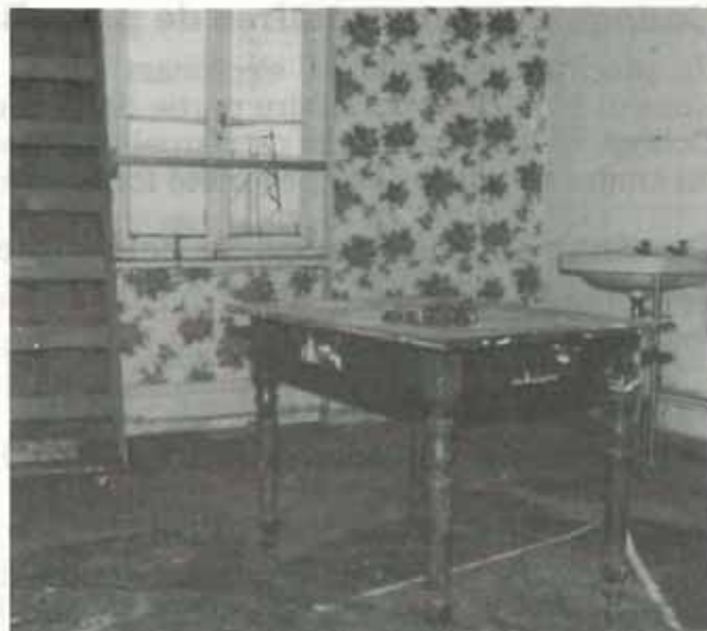
Une rénovation nécessaire...