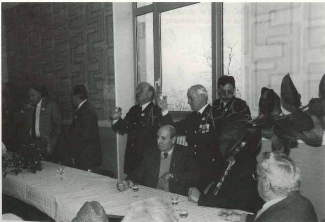
Au vin d'honneur, les pompiers lèvent leur verre

Une cérémonie semblable avait eu lieu précédemment à la Borne des Commandos, place de Leusse, où ont eu lieu le dépôt de gerbes et l'appel des morts suivis de la minute de silence.