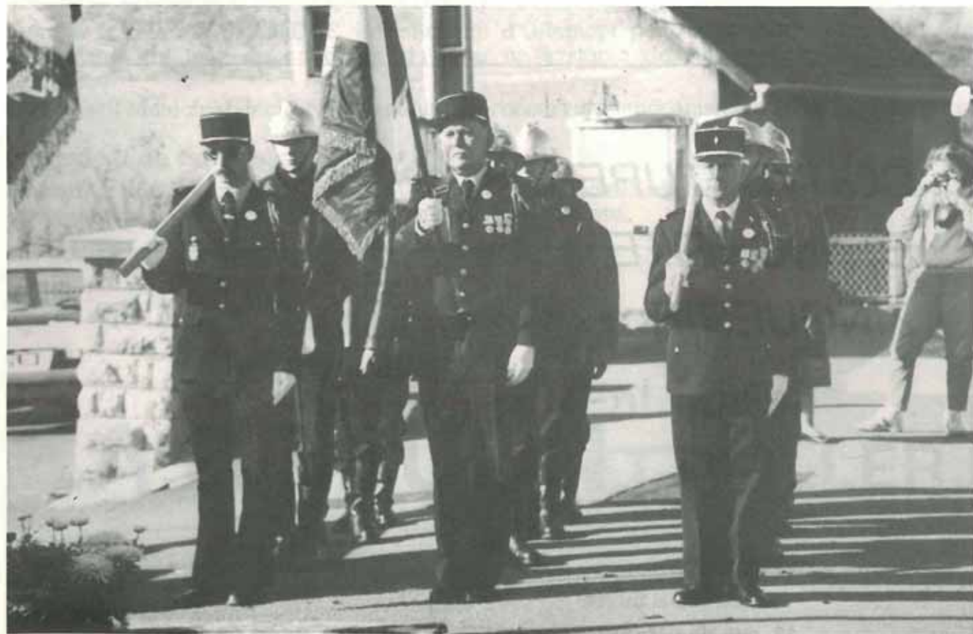
Les pompiers, souvent sollicités...

Les taux sont majorés de 100 % pour les interventions effectuées de minuit à sept heures, et de 50 % pour les jours fériés.