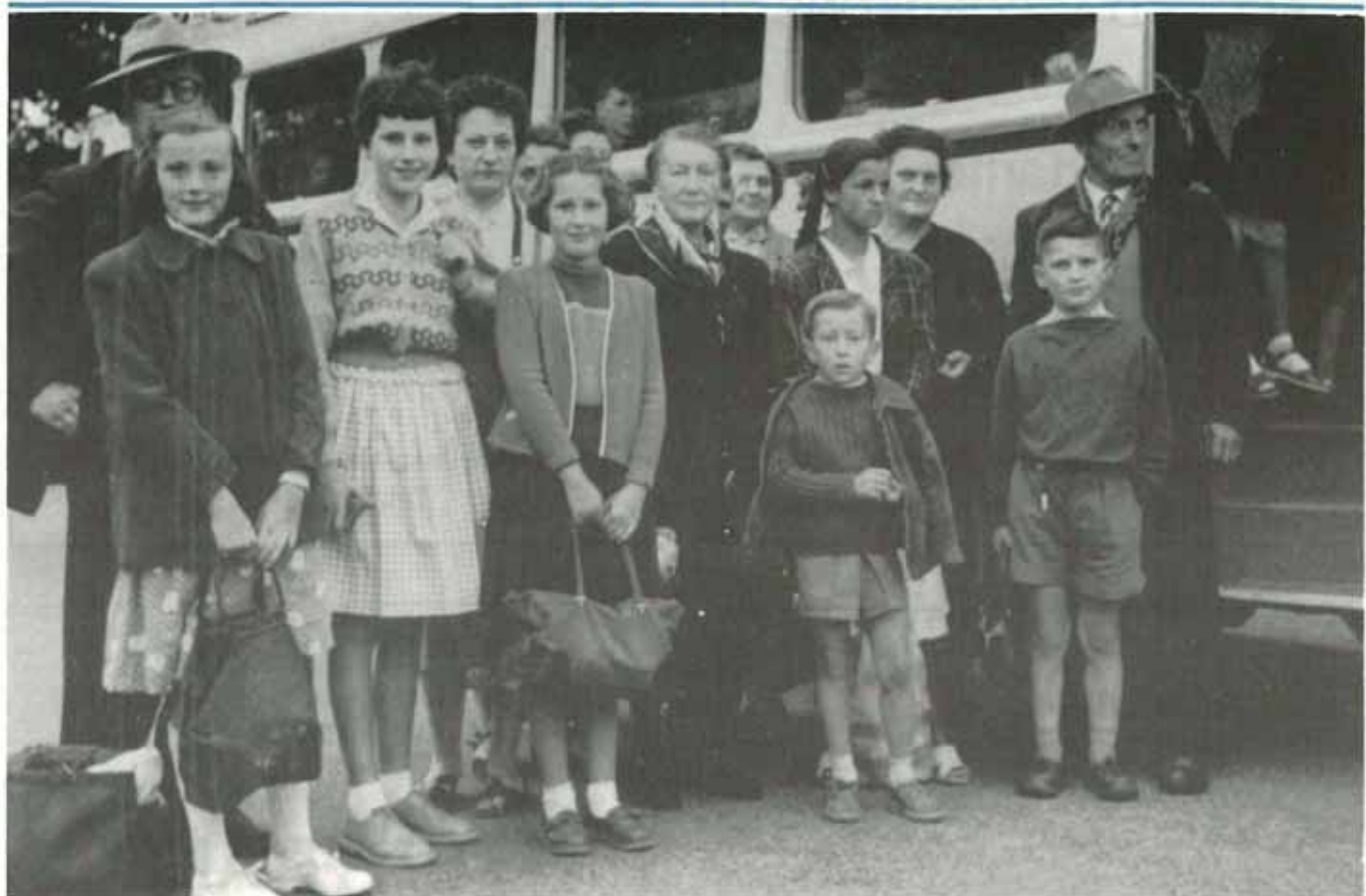
Sortie au Mont d'Or en 1956 avec le groupe scolaire. Télesiège jusqu'au sommet. Vue sur les Alpes, le Ballon d'Alsace, le lac de Genève. Retour par Neufchatel ; promenades sur le lac.