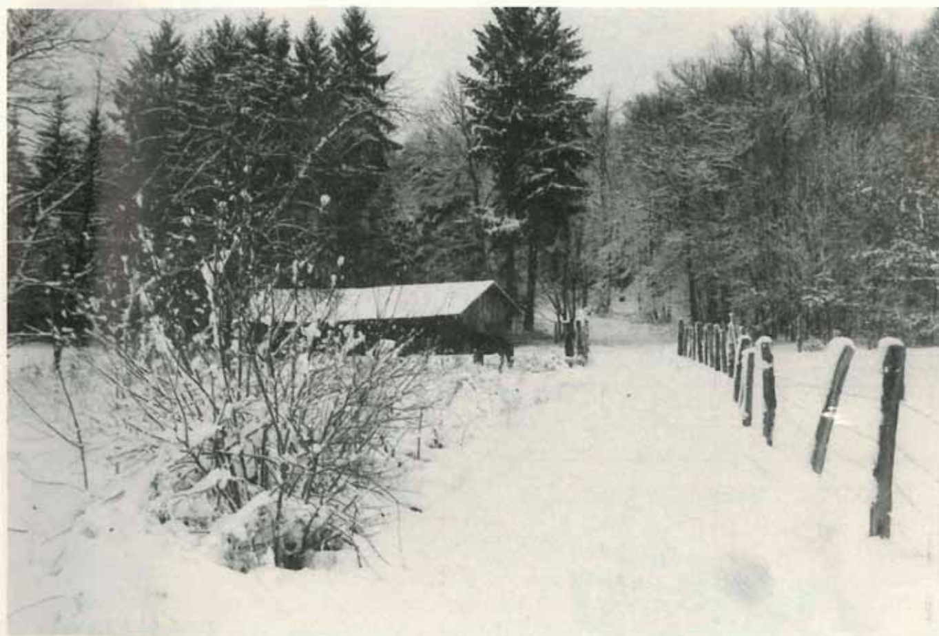
Accès à la forêt d'Offemont par la rue du Chêne.