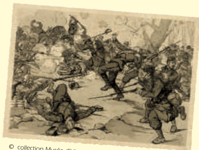
© collection Musée d'Histoire de Belfort - reproduction interdite

Acte transcrit par le Maire : François BOUVIER.