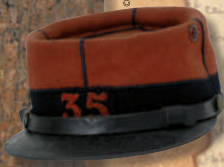
© collection Musée d'Histoire de Belfort. Reproduction interdite