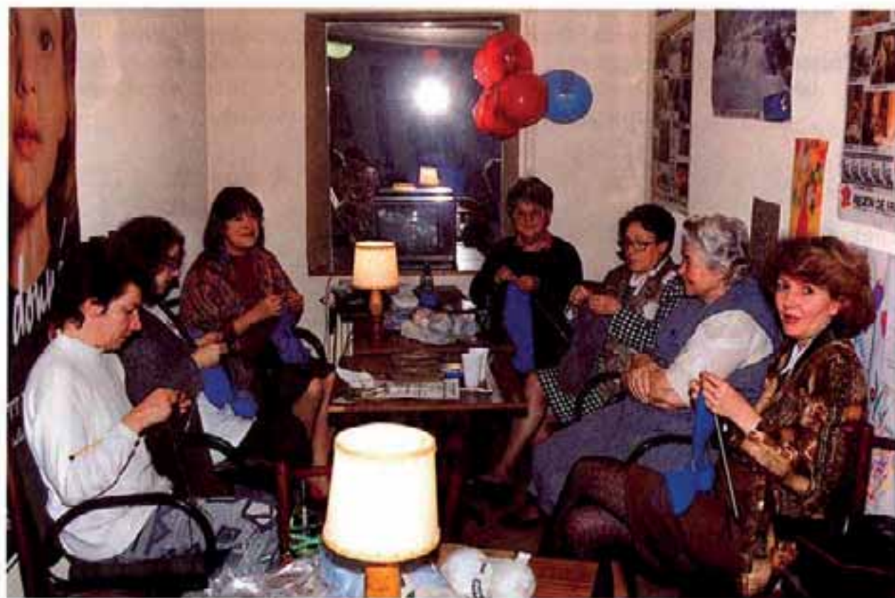
Le rang de tricot a été vendu 1 F au profit du Téléthon ; des habitantes de longue date d'Offemont, de nouvelles arrivantes et des conseillères municipales se sont retrouvées entre minuit et quatre heures du matin au coude à coude.