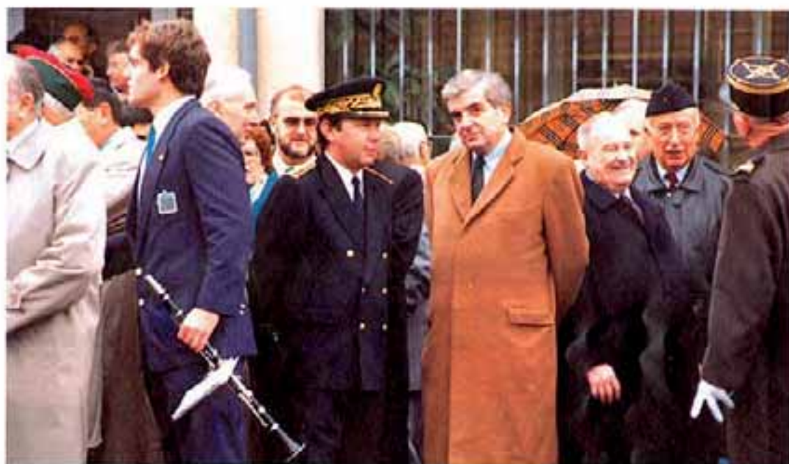
A la borne du Martinet

Puissent les hommes, les hommes de tous pays, par delà leurs divergences politiques ou religieuses, leurs différends économiques ou territoriaux, être assez sages pour se souvenir, et pour conserver aux générations présentes et futures le bien sans doute le plus précieux de l'humanité : la paix.