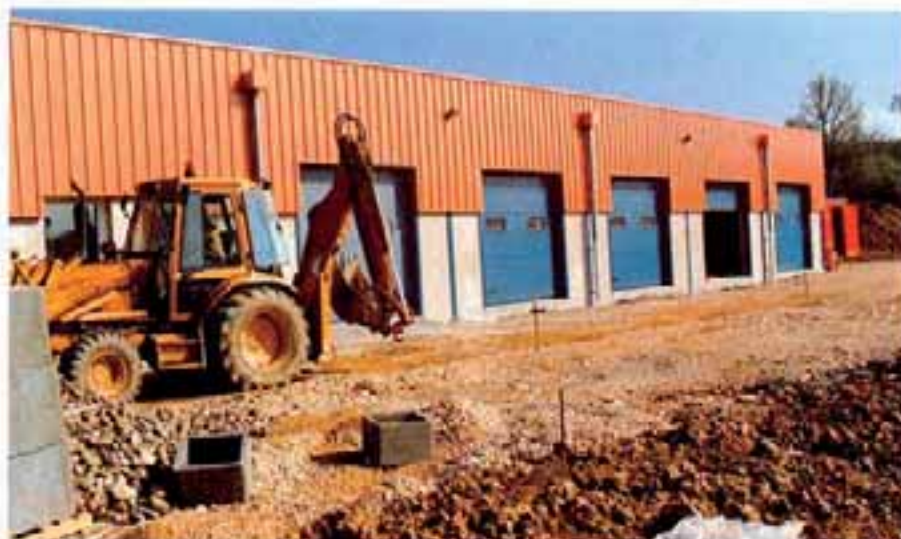
Les ateliers municipaux

Ils sont implantés sur la ZAC. La construction du bâtiment est quasiment achevée.