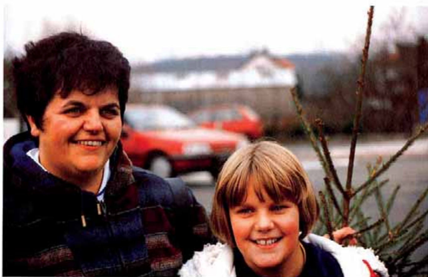
L'achat du sapin de Noël = la joie anticipée. Des cadeaux ont été déposés par les enfants pour d'autres moins chanceux.