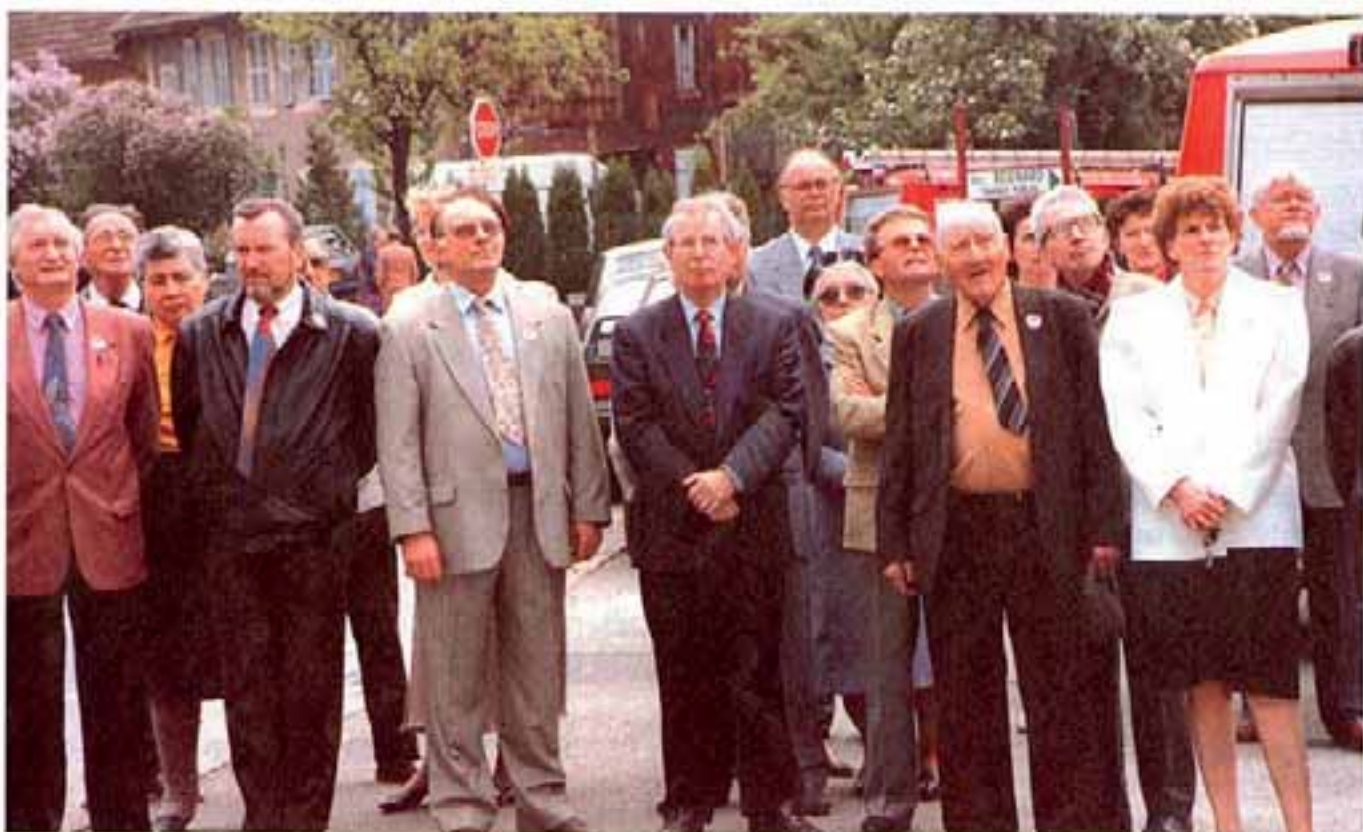
M. le Maire de Vétrigne et de nombreux conseillers municipaux d'Offemont.