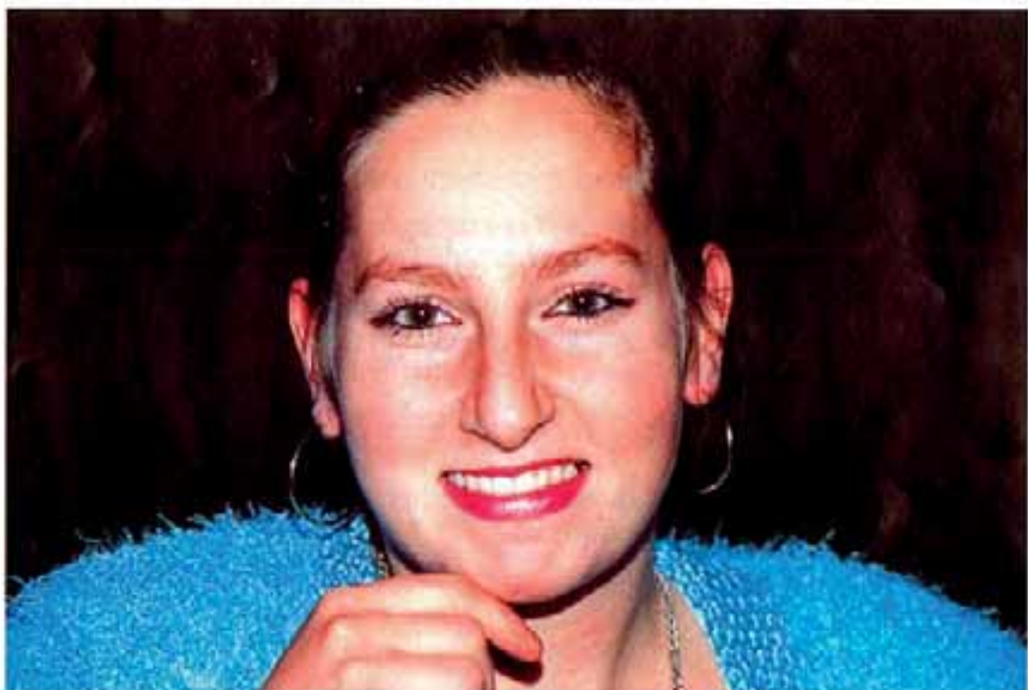
Le radieux sourire d'une époustouflante danseuse de flamenco.