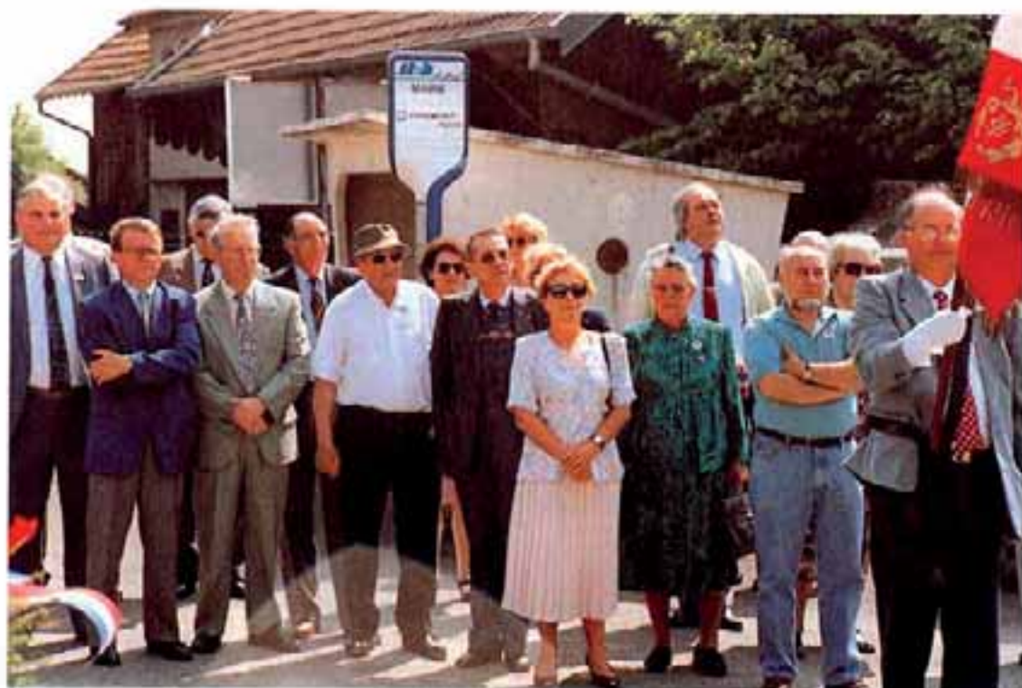
De nombreuses personnes assistaient aux cérémonies du 8 mai 1995.