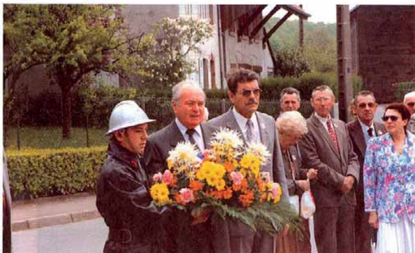
M. le Maire d'Offemont et M. le Président des Anciens Combattants.