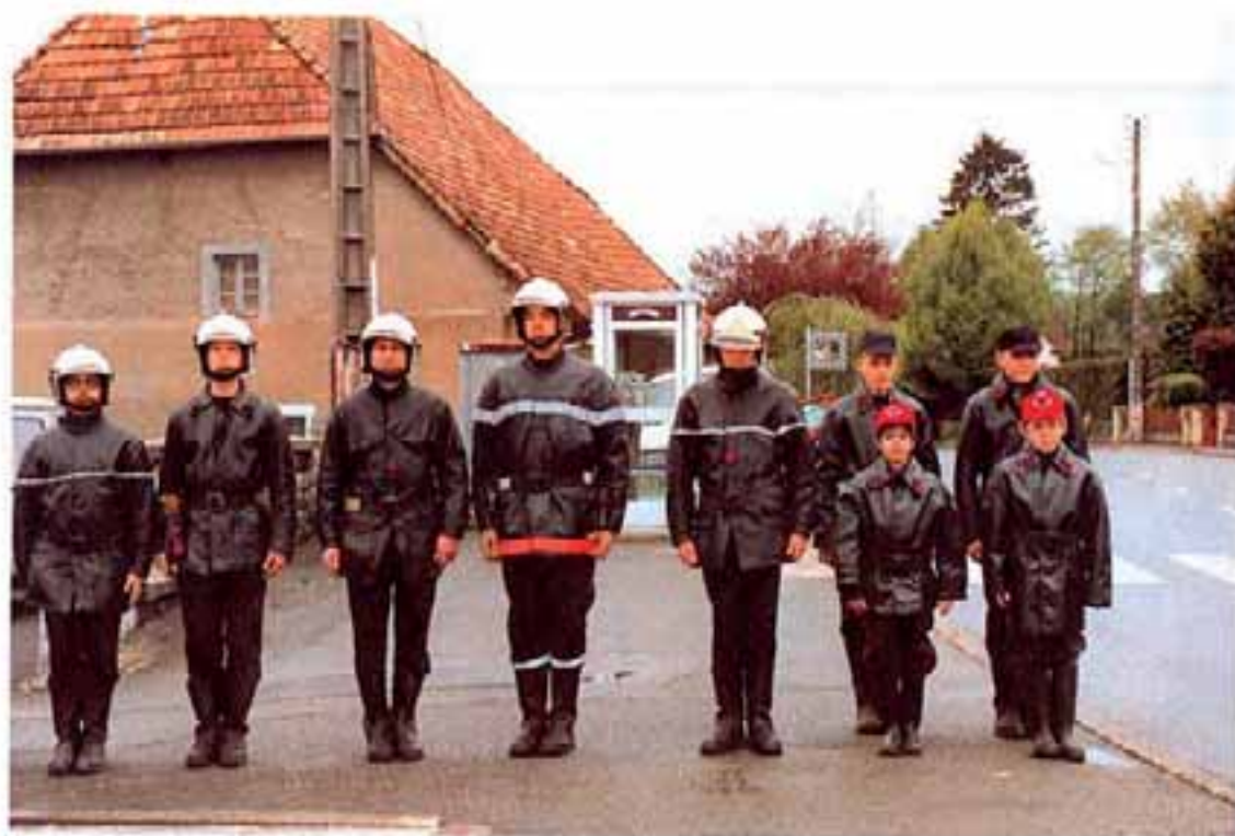
Le corps des sapeurs-pompiers d'Offemont était présent aux cérémonies du cinquantenaire de la Libération des camps de concentration.