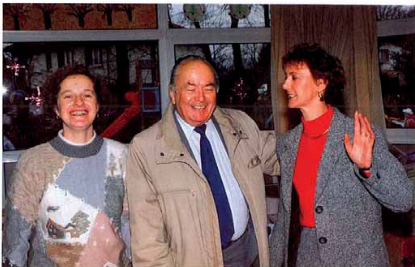
Monsieur le Maire est venu admirer les travaux des classes de la maternelle. Mais c'est incontestablement l'heure de la récréation...