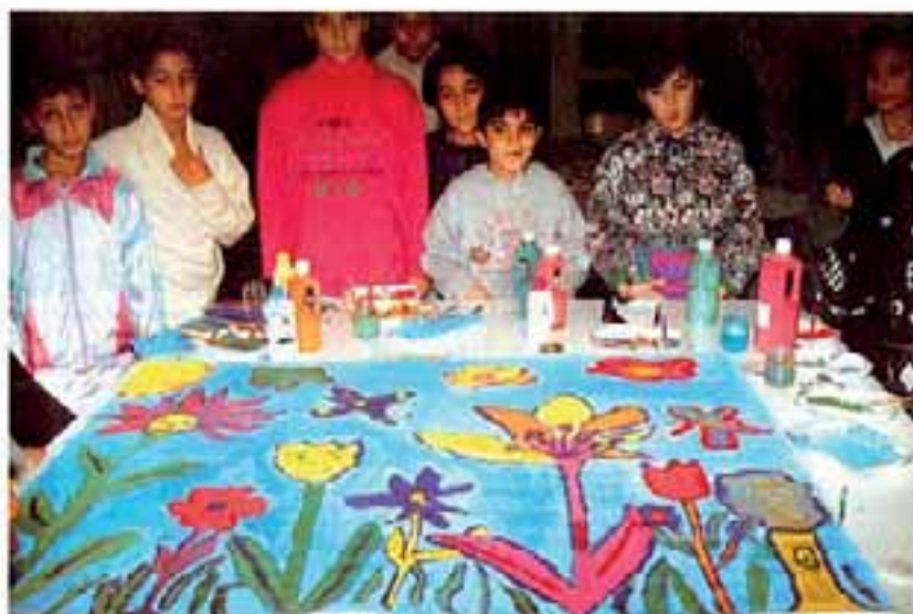
Les enfants des 3 écoles d'Offemont ont préparé de merveilleux dessins : ci-dessous des enfants de l'école Jean Macé, légitimement fiers de leur somptueuse fresque estivale.