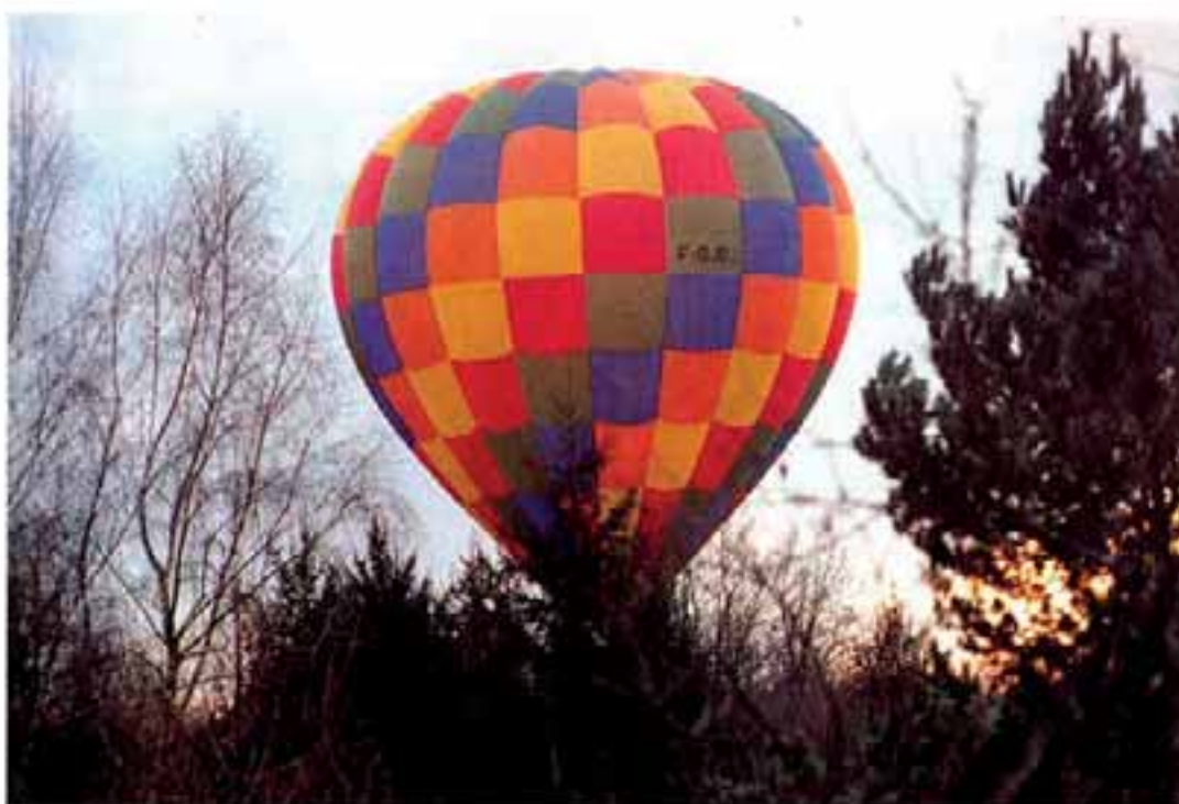
L'envol de la montgolfière : spectaculaire.